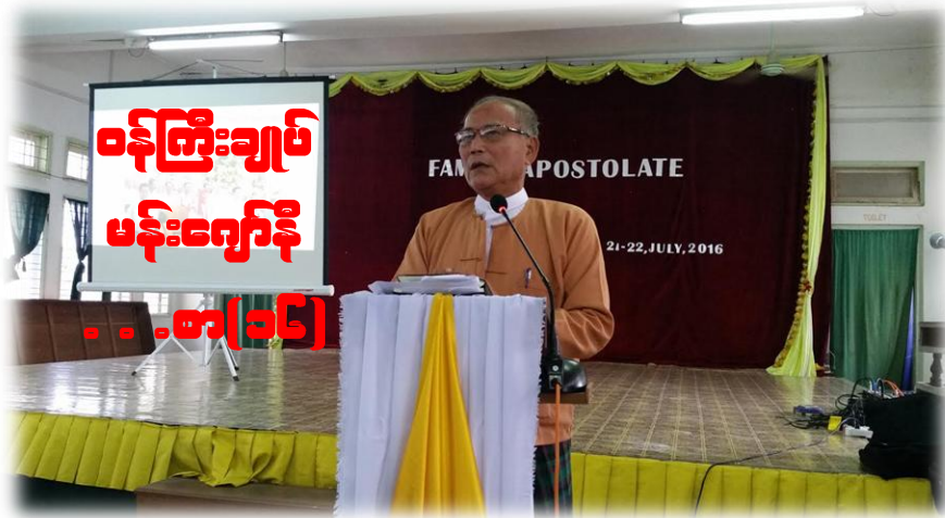
ဝန်ကြီးချုပ် မင်းကျော်နီ - စာ(၁၆)