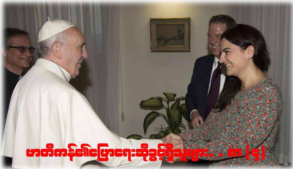
ဖာတီကာ၏ပြောရေးဆိုခွင့်ရှိသူများ . . . စာ (၄)