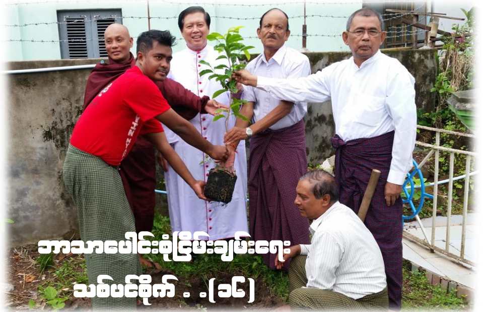
ဘာသာပေါင်းစုံငြိမ်းချမ်းရေး ဆစ်မင်စိုက် - (၁၆)