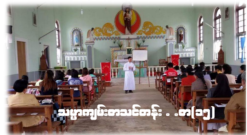
သမ္မာကျမ်းစာသင်တန်း - စာ(၁၅)