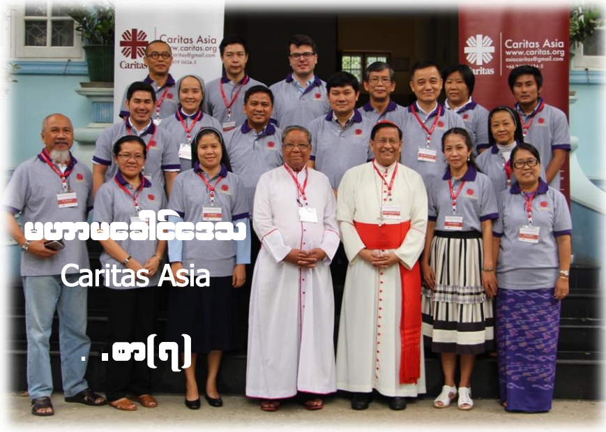
မဟာမခေါင်ဒေသ Caritas Asia - စာ(၇)