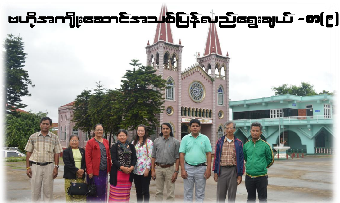
ဗဟိုအကျိုးဆောင်အသစ်ပြန်လည်ရွှေးချယ် - စာ(၉)