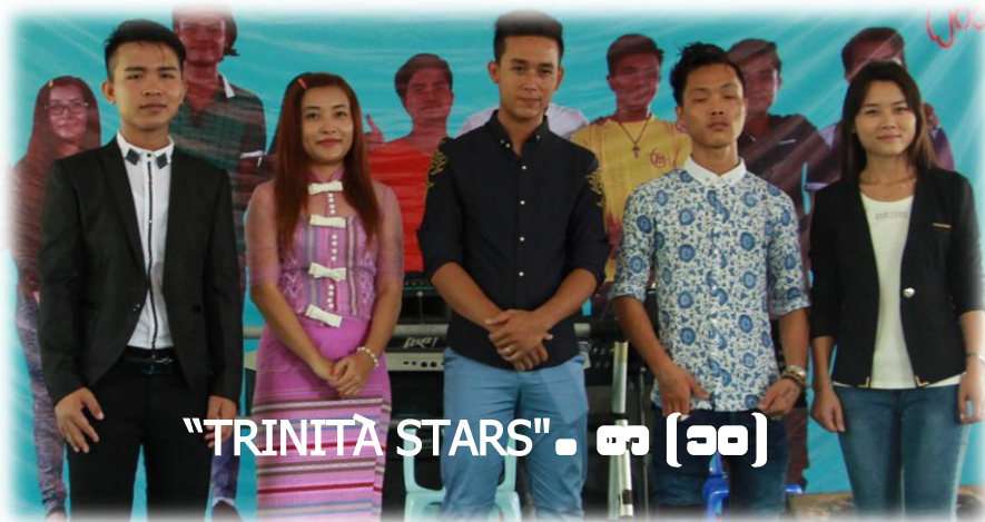
"TRINITA STARS" . . . စာ (၁၀)

ကမ္ဘာအရပ်ရပ်သို့သွားကြ၍ဧဝံဂလိတရားတော်ကိုဟောပြောကြလော့။