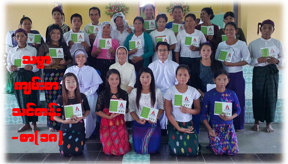
သမ္မာ ကျမ်းစာ သင်တန်း - စာ(၁၈)