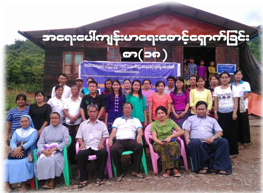
အရေးပေါ်ကျန်းမာရေးစောင့်ရှောက်ခြင်း စာ(၁၈)