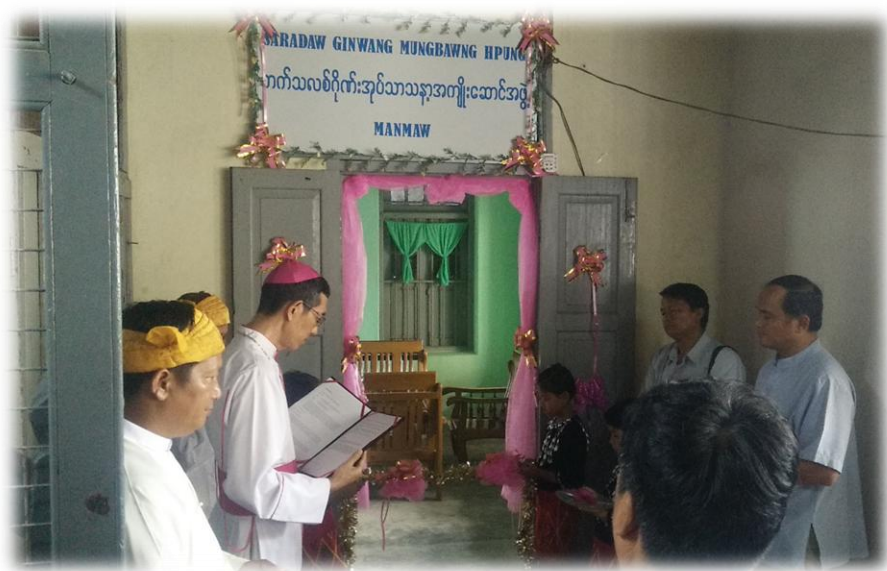
ဗာသာရ်တူးဂျာ (Banmaw-Osc)

အတူ တစ်စတစ်စ ဖွံ့ဖြိုးတိုးတက်လာခဲ့ရာ ၂၀၁၂မှ ၂၀၁၄ အထိ ဗန်းမော်ဂိုဏ်းအုပ် သာသနာလုံးဆိုင်ရာ အစည်းဝေးများ အကြိမ်ကြိမ် ပြုလုပ်ပြီးနောက် ၂၀၁၄ခုနှစ် မတ်လ(၂၅)ရက်မှ (၂၈) အထိ ကက်သလစ်အသင်းတော် ဗန်းမော်ဂိုဏ်းအုပ်သာသနာလုံးဆိုင်ရာ စုံညီ အစည်းအဝေးကြီးကို ကျင်းပနိုင်ခဲ့ပါသည်။ ထိုအစည်းအဝေးကြီးတွင် အတည်ပြုပြဌာန်းခဲ့သော လုပ်ငန်းစဉ်ဗျူဟာအတိုင်း ဗန်းမော်ဂိုဏ်းအုပ် သာသနာသည် ရှေ့သို့ဆက်လျှောက်လှမ်းလျက်ရှိကြောင်းသိရသည်။