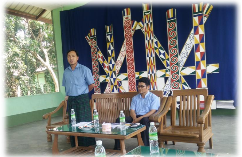
မူးယစ်ဆေးဝါးပပျောက်ရေး - စာ(၉)